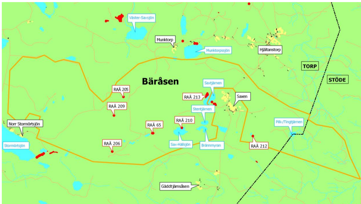
Figur 2. Utredningsområdet berör delar av Torp och Stöde socknar. Kring utredningsområdet finns det flera registrerade kulturhistoriska lämningar. Innanför finns sju registrerade kulturhistoriska lämningar, se tabell 1. Endast de fornlämningar som ligger inom UO redovisas med nummer.