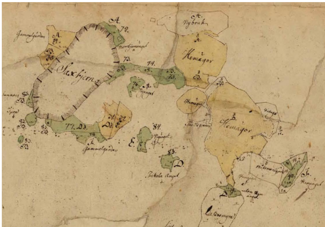
Figur 3. Utsnitt ur storskifteskarta från 1797 (22-tor-120). Observera Båtsmansgård till höger och Gammalgården till vänster i bilden.

Vid ett gränsområde mellan Saxen, Hjältanstorps, Gransjön och Ulvsjön, i utredningsområdets östra del, finns namnen Pilkjärnen (Tingjärnen), Pilkåsen, Pilkbäcken och Stor-Pilkmyran. Ordet Pilk- kommer från det finska ordet pilkku som betyder ställe där man bläcktat träd (Wedin 1979). Namnen kan indikera att det finns gamla gräns- eller ledmarkeringar i form av bläckor. Över Pilkjärnen/Tingjärnen går gränsen mellan socknarna Torp och Stöde.