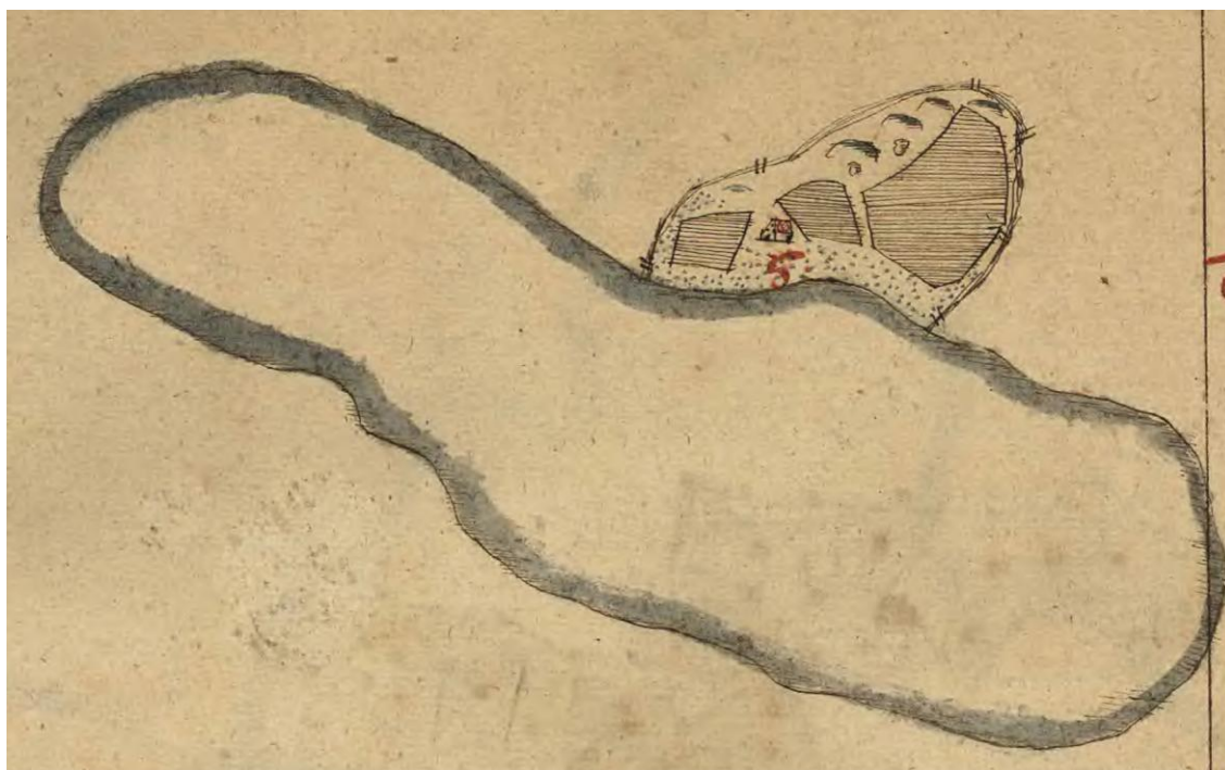
Figur 4. Utsnitt ur geometriska karta från 1639 (X62-42-v1-75-78, Tresk) som visar Saxens norra gård belägen på Saxtjärns nordvästra strand. Kartan är troligen felriktad och norr ska vara åt höger.

Den ekonomiska kartan (1966) visar på ett par kvarvarande samfälligheter, några stigar och tre platser/gårdar med bebyggelse. På samfälligheter kan en mängd olika aktiviteter ha förekommit till exempel olika typer av täkt, plats för såg, kvarn med mera.