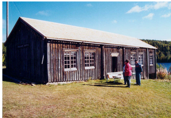
Finnportet med nytt spåntak