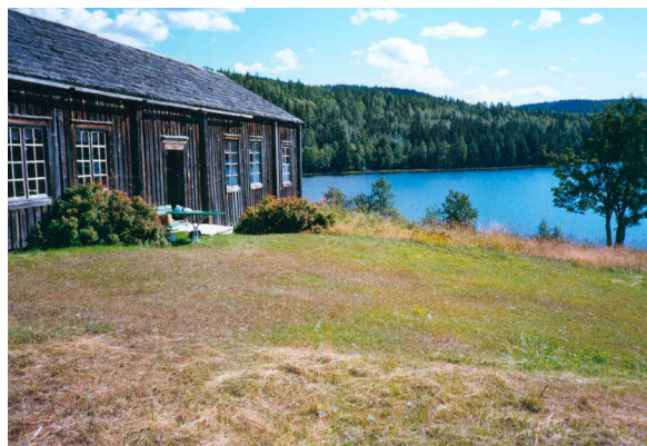
Finnportet före takomläggning

Hembygdsföreningen kommer att dränera runt huset, gräva bort jordmassor som ligger mot fasad och stomme, främst på baksidan.