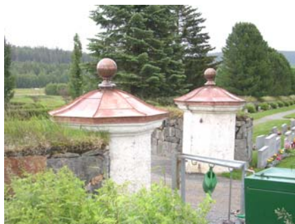
Allén sedd från insidan av muren med silvergranen närmast. Nya kopparhuvar. 2004 07 02.