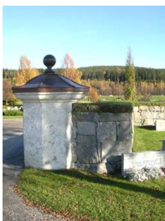
Före resp. efter restaurering av murverk mot östra kolonnen, norra muren, 2004 07 02, 2004 10 11.