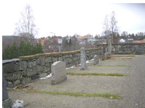
Restaurerad mur mellan gravkapellet och västra muren 2005 10 24.

Endast smärre justeringar gjordes med inskolning av enstaka småsten, ingen demontering av muren. Man har anlagt platonmatta och återställt torvtäckten. Arbetet utfördes under oktober månad 2005.