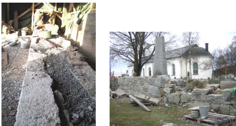
Mur vid graven, där tujorna stått under återuppbyggnad. 2005 10