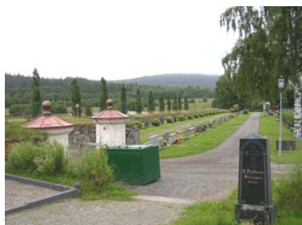
Insidan av muren efter trädfällning. 2004 07 12.