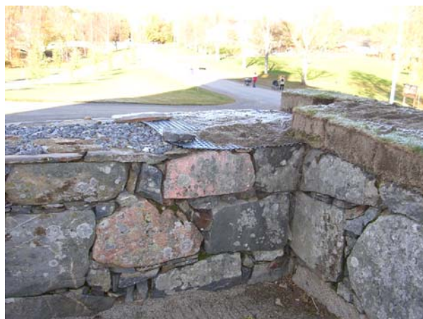
Objekt 4. NV delen av kyrkogårdsmuren, nylagd torv, platon, respektive singelmatta. Foto 2004 10 11.

Endast smärre justeringar gjordes med inskolning av enstaka småsten, ingen demontering av muren. Man har anlagt platonmatta och återställt torvtäckten. Arbetet utfördes under oktober månad 2004.