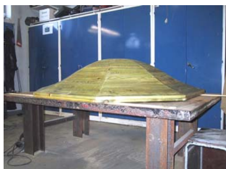
Huvarna rekonstrueras.

kopparhuvorna hade enligt uppgift varit uttjänta och kasserats. Man har skurit nya rotebräder i en svängd form av tryckimpregnerat virke, likt respektive originalhuvorna. Restaurering av stigportens huvar hade tidigare under våren följts av Örnsköldsviks museum, som även deltog i byggmöte innan Läns museet kontaktades i juli. Spritputsens på pelarna är starkt nersmutsad och församlingen planerar själva rengöra och underhålla med kalkfärg enligt nuvarande utseende. Muren som ansluter till östra kolonnen var murad med bruk. På grund av alltför stark vidhäftning hade en spricka uppstått mellan mur och kolonn, eftersom resten av muren är kallmurad. Murverket är nu återställt.