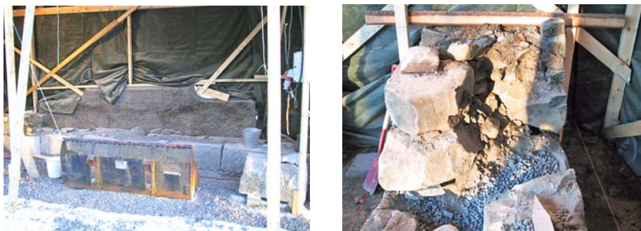
Muren är grundlagd som skalmur bakom graven 2004 11 26. Ursprunglig murdel mot väster (t h).