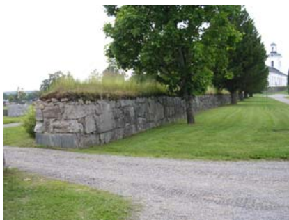
Allén mot öster, utsidan av muren 2004 07 02. Allén mot väster 2004 07 02.