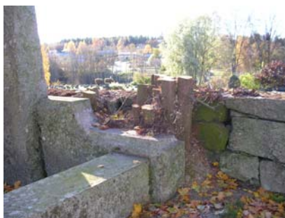
Fällda tujor vid graven. Foto mot söder. 2004 10 11.