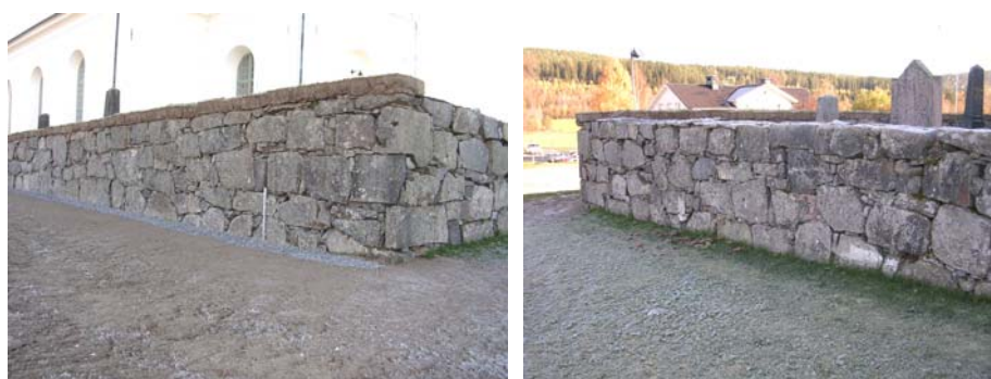
Objekt 4. Norra (NV) delen av den restaurerade muren torvtäckes. Västra (NV) muren. 2004 10 11.