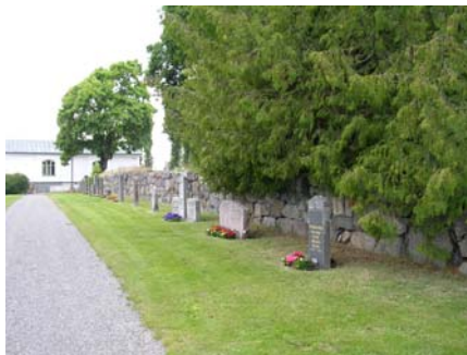
Ovan: Tujor som har växt in i södra muren med långa grenar även utanför muren. Gravkapellet i väster. Foton 2004 07 02.