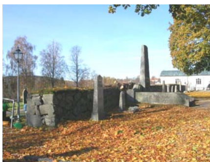
Fällda tujor. Foto mot norr, 2004 10 11. Foto mot väster 2004 10 11.