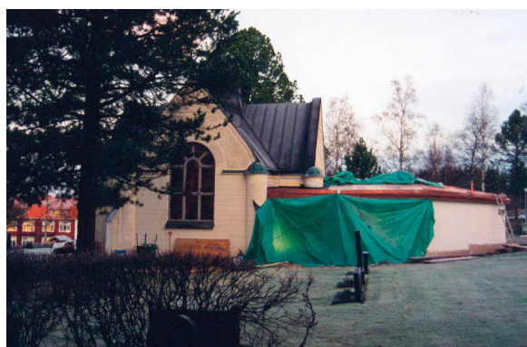
Kapellet och tillbyggnaden från söder