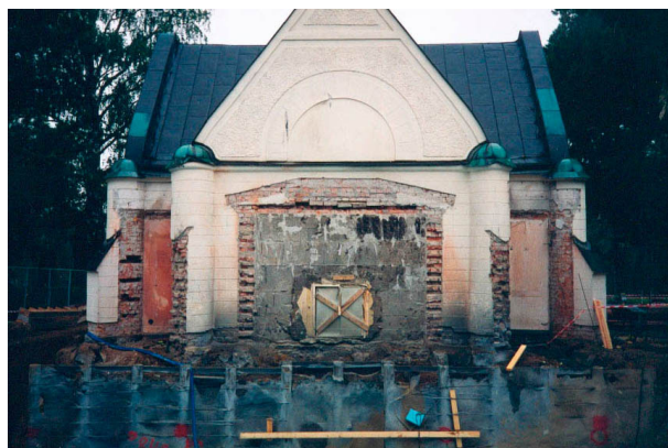
Gravkapellet från norr med tillbyggnaden under byggnad

Detaljarbeten och färgsättning var i slutändan inte bra. Både läns museet och länsstyrelsen hade synpunkter på det utförda arbetet. Församlingen önskade även de åtgärda detta och slutjusteringen, bl a ny färgsättning på tillbyggnadens fasad och fönsterbågar, genomfördes 2003 i samband med att man putsade om kapellet.