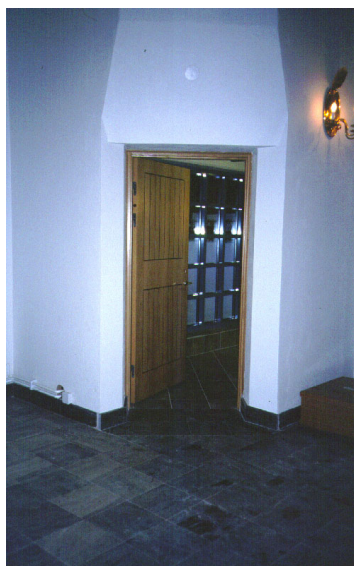
Ny öppning från kapellet till tillbyggnaden