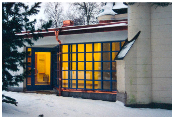
Tillbyggnadens glasparti från norr