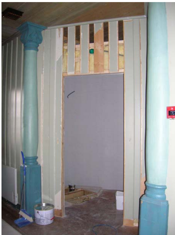
2007 05 11. Breddning av wc-dörren.