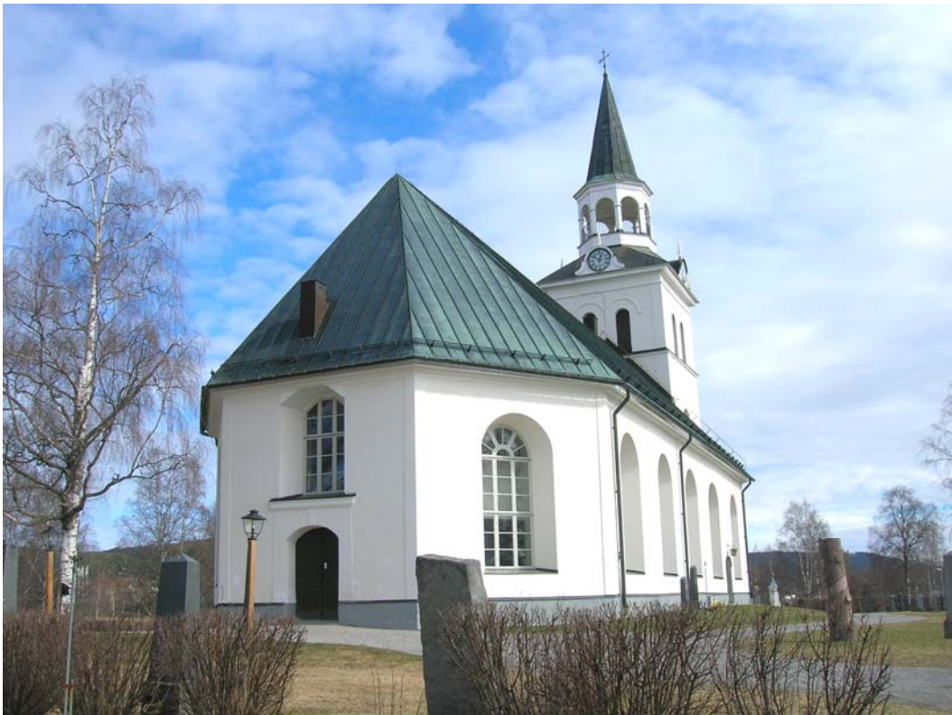
Stöde församling, Sundsvalls kommun, Medelpad

Rapportnummer 2008:7 Kulturmiljöavdelningen, Bodil Mascher