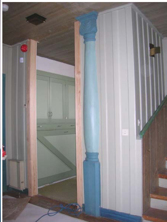
Ingång till kapprum före åtgärder 2007 04 23. Till höger: Rivet väggparti och breddad öppning mot kapprum 2007 05 11.