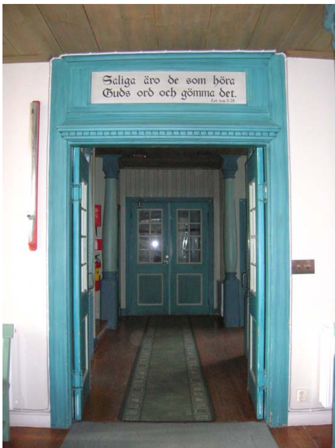
Foto från kyrkorummet mot läktarunderbyggnaden före åtgärder 2006 05 17.

Vidare planeras nytt skyddsräcke i järn på orgelläktaren samt heltäckande matta i sakristia och på läktare.