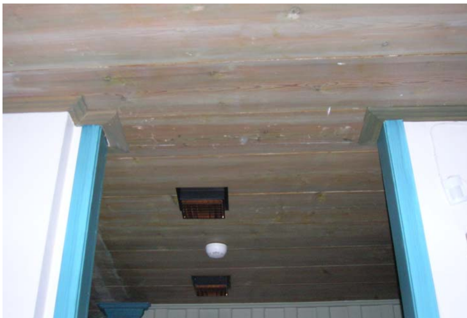
2007 12 04. Inifrån kapprummet med ny taklist lik befintlig kring ny väggöppning.