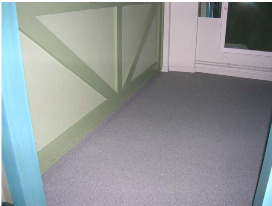
2007-12-04. Ny matta även i kapprummet.

Efter församlingens kontakt och tillstånd av Länsstyrelsen lades samma typ av matta även i kapprummet i läktarunderbyggnadens södra del.