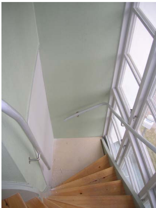
2007 05 11. Baksidan av väggen till den igensatta norra trappan under uppbyggnaden. Foto från läktarvåningen.