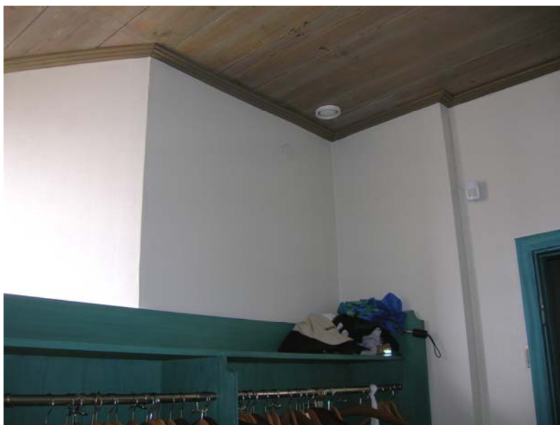
Klädhängaren gick tidigare rakt ut från väggen. Foto före åtgärder 2007 04 23.

I kapprummet på södra sidan har ett väggparti rivits och den tidigare dörröppningen tagits bort enligt program, så att öppningen in mot kapprummet har blivit bredare. Öppningen avslutas nu någon decimeter från södra kolonnen vid trappan enligt ritning. Den nya ingången mot kapprummet har vid anslutning till taket fått en taklist med samma profil som befintlig, i stället för det rakt avsågade fodret som inledningsvis gjordes. Läktartrappan i söder berörs ej. Den raka kapphyllan inne i kapprummet har byggts om och vinklats enligt program.