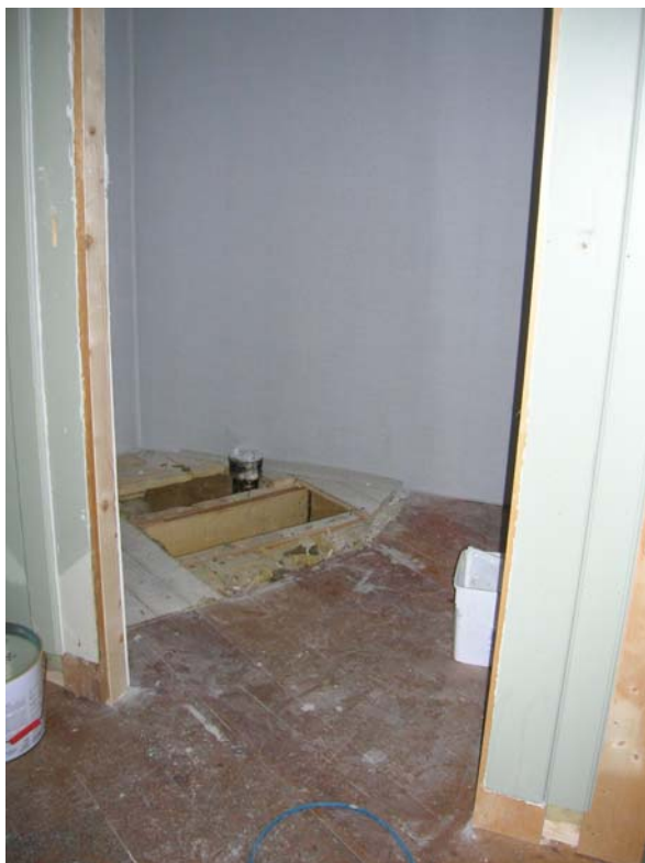
Wc under ombyggnad. 2007 05 11.