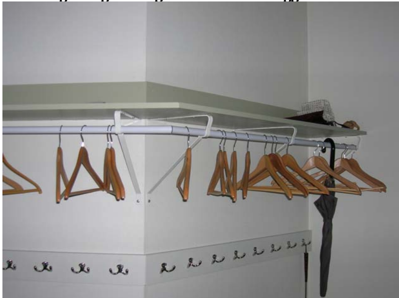
2007 07 02. kapprummet efter ombyggnaden med vinklats hatthylla.