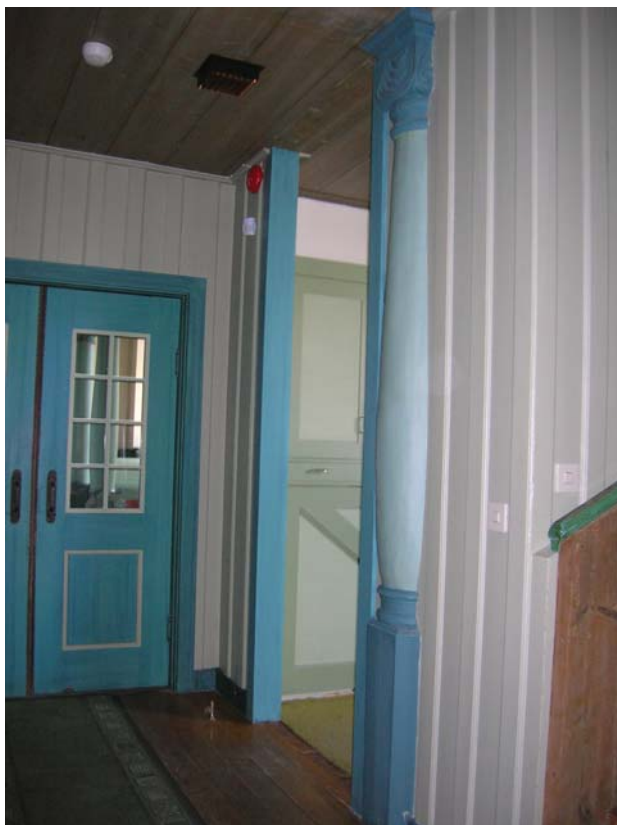
2007 07 02. Ingång till kapprummet efter ombyggnaden.