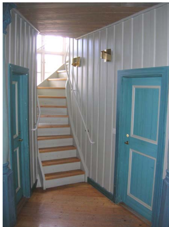
Foto 2007 04 23 före wc-dörrens (t v) breddning och norra läktartrappan (dörr till skrudrum till höger berörs ej).