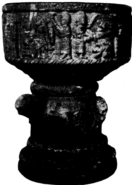
Dopfund, gotländskt arbete från omkr. 1220 i Nora kyrka, Angermanland.