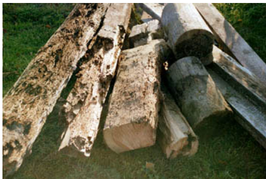
Borttagen rötskadad syllstock