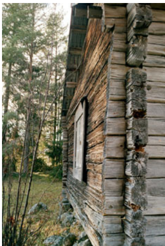
Södra gavel och sydöstra knuten