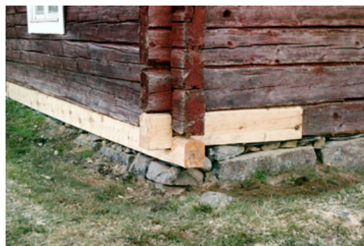
Ny syllstock på östra och norra fasaden