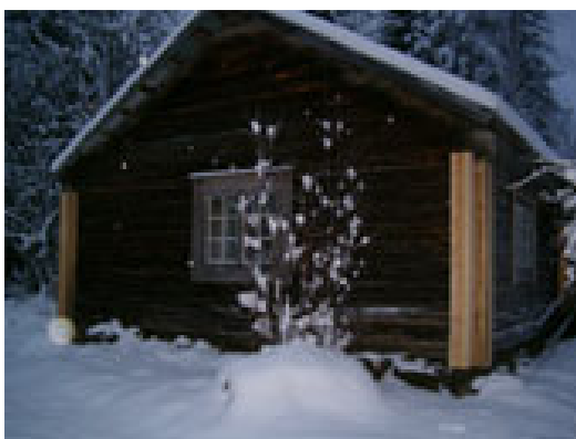
Södra fasaden med nya knutlådor