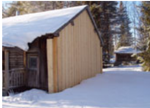
Norra gaveln efter åtgärd