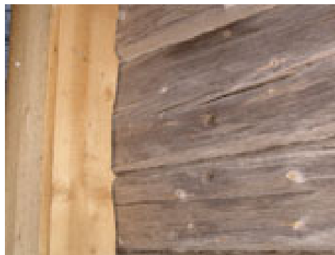
Nyttillverkad knutlåda vid sydöstra knuten