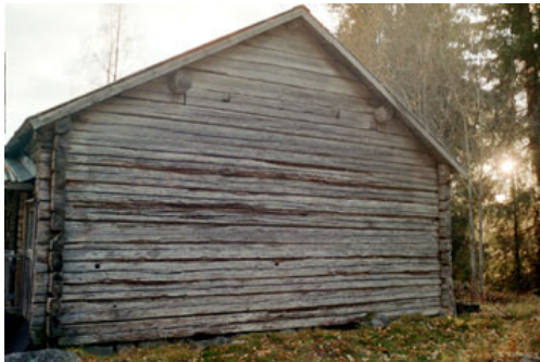
Norra gaveln före åtgärd.

Bygganden har idag ett plåttak. Ägaren skulle gärna se att det lades spåntak på byggnaden istället. Antikvarien ansåg att om vi nu arbetat med att stoppa upp åverkan på byggnaden med offerpanel och knutlådor så är ju faktiskt plåttaket ett annat sätt att bevara byggnaden. Det är inte någon prioriterad åtgärd när det finns andra byggnader i byn som är i mycket dåligt skick och borde komma i första hand för att inte förstöras totalt inom några år.