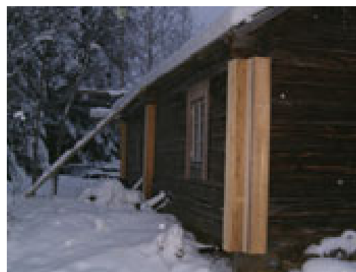
Västra fasaden med nya knutlådor