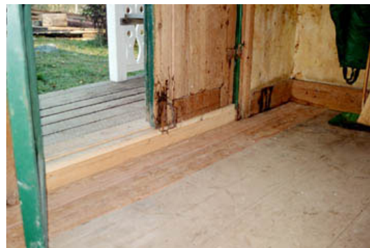
Ny syllstock och golv i farstu