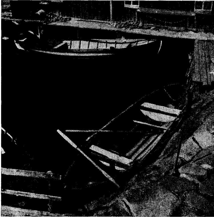
I den utmärkta hamnen äro båtarna skyddade för alla vindar. I förgrunden en äldre skötbåt, en fembording.

och betalt två andelar av fiskearrendet och därför haft två nummer.