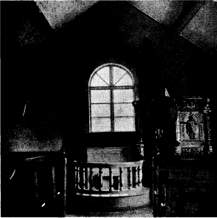
Kapellets enkla interiör prydes av en praktfull predikstol, en till 1330-talet daterad madonnabild, ett krucifix, en helgonbild och en med Kristus och apostlarna målad predella från ett altarskåp.