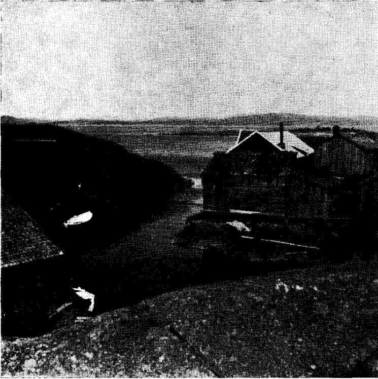
Vid en väl skyddad vik på Södra Ulvön ligger Grunnans fiskeläge, nu det enda av de förr så talrika säsongbebodda fiskelägena vid Ångermanlandskusten, vilket fortfarande bebos sommartid men som icke fått permanent bebyggelse.