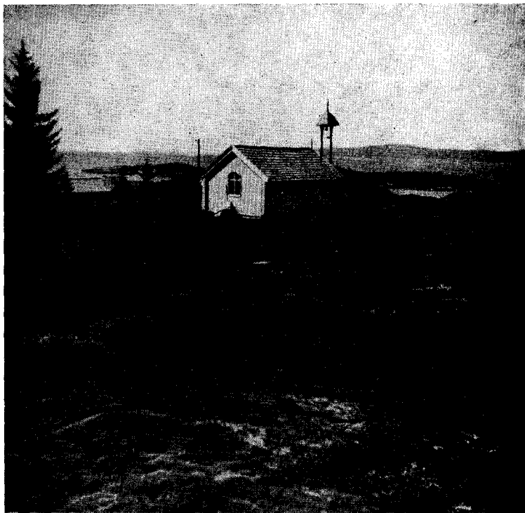
På berget ovanför hamnens sammanträngda bebyggelse ligger det lilla kapellet. Det är uppfört av gävlefiskare år 1771. Gudstjänst hålles här en gång varje sommar av kyrkoherden i Vibyggerå.