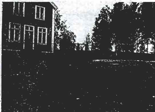
Dier. 3865 Jno. 21175. Nr 1 i rapporten. Feb. 1935. E. Floderus.