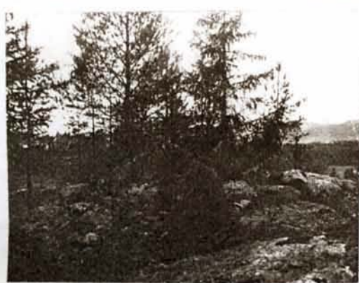
or 2805 Röse. 1934