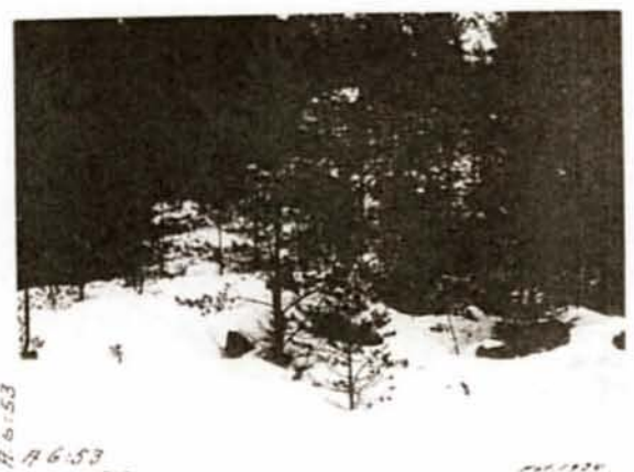
H. 6:53 A 6:53 Diat. 313 1934