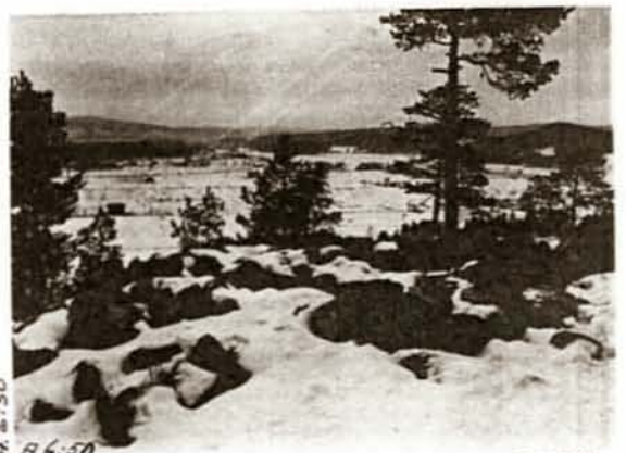
H. 6:50 A 6:50 Diat. 313 1934