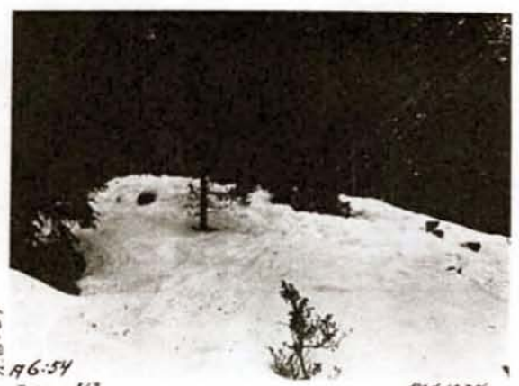
H. 6:54 A 6:54 Diat. 313 1934