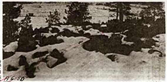
R. 4:50 A 6:50 Diar. 313 1934