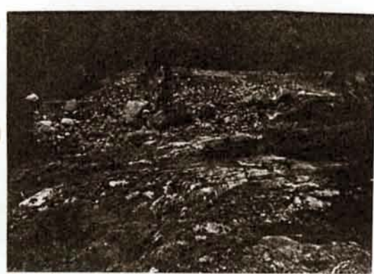
Divr. 2805, Röse. 1934