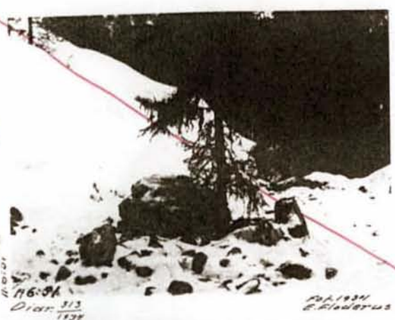
H. 6:57 A 6:57 Diat. 313 1934