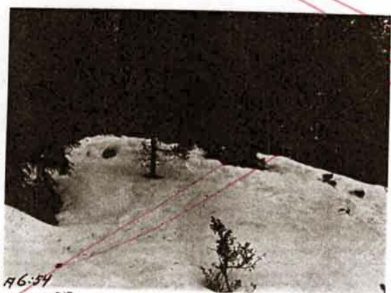
R. 6:54 A 6:54 Diar. 313 1934