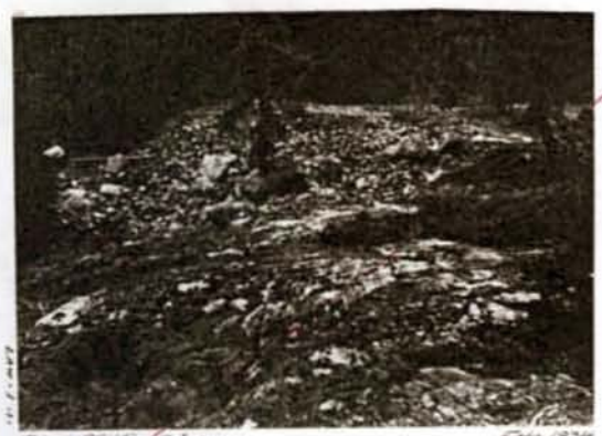
H. 6:57 Diat. 313 / Röss 1934