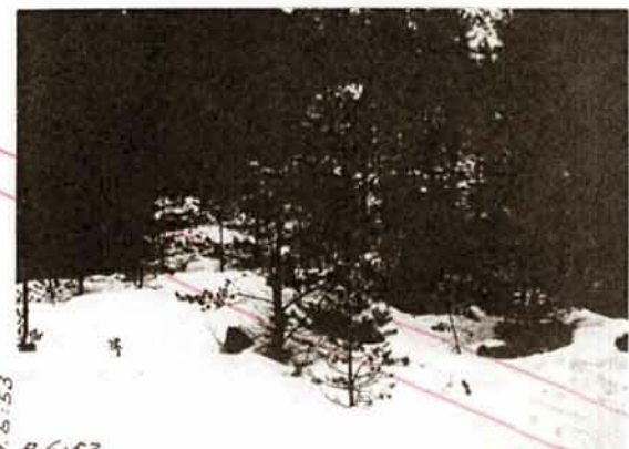
R. 5:53 A 6:53 Diar. 313 1934