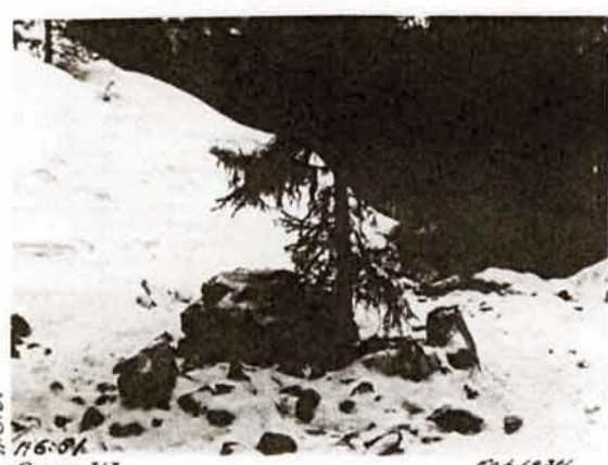
R. 6:51 A 6:51 Diar. 313 1934