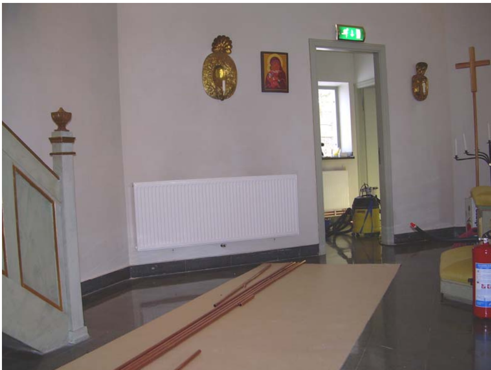
2008-02-28. Installation av vattenburen radiator vid korets norra sida.

Mellan koret till långhuset finns en höjdskillnad på tre trappsteg. De vattenburna ledningarna har dragits ut till norra och södra sidogångarna i kyrkorummet, där befintliga el-radiatorer har ersatts med nya vattenburna radiatorer. De är cirka 3 meter långa men placerade mycket lågt. De nya radiatorerna syns knappt alls eftersom de går nedanför bänkarnas överkant. Dessutom är bänkarna utrustade med gavlar, som skymmer ett stycke av väggarna. Rördragningen till de nya väggradiatorerna har skett under brädgolv. Golvet, som är från senare tid, återlades igen på samma sätt som tidigare.