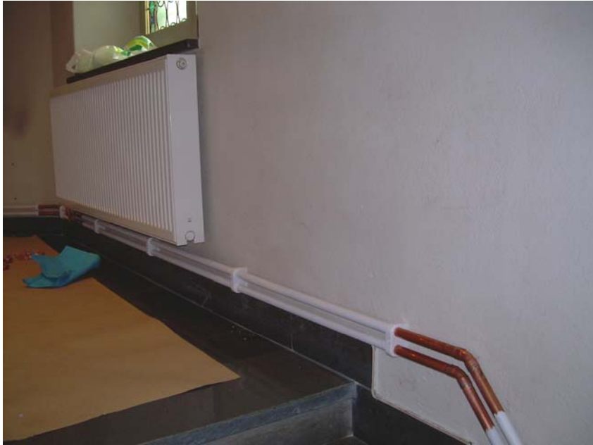
2008-02-28. Rörledning och nya radiatorer utmed södra väggen vid koret.

Mellan koret till långhuset finns en höjdskillnad på tre trappsteg. De vattenburna ledningarna har dragits ut till norra och södra sidogångarna i kyrkorummet, där befintliga el-radiatorer har ersatts med nya vattenburna radiatorer. De är cirka 3 meter långa men placerade mycket lågt. De nya radiatorerna syns knappt alls eftersom de går nedanför bänkarnas överkant. Dessutom är bänkarna utrustade med gavlar, som skymmer ett stycke av väggarna. Rördragningen till de nya väggradiatorerna har skett under brädgolv. Golvet, som är från senare tid, återlades igen på samma sätt som tidigare.