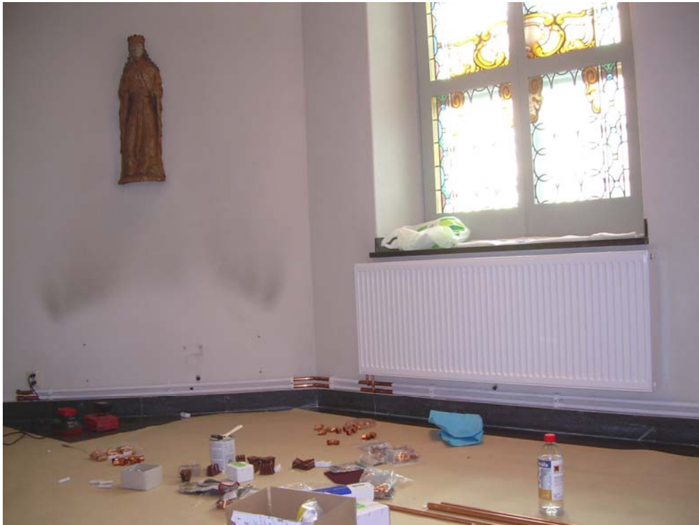
2008-02-28. Ny vattenburen rörledning från förråd till kor före inmålning av rör.