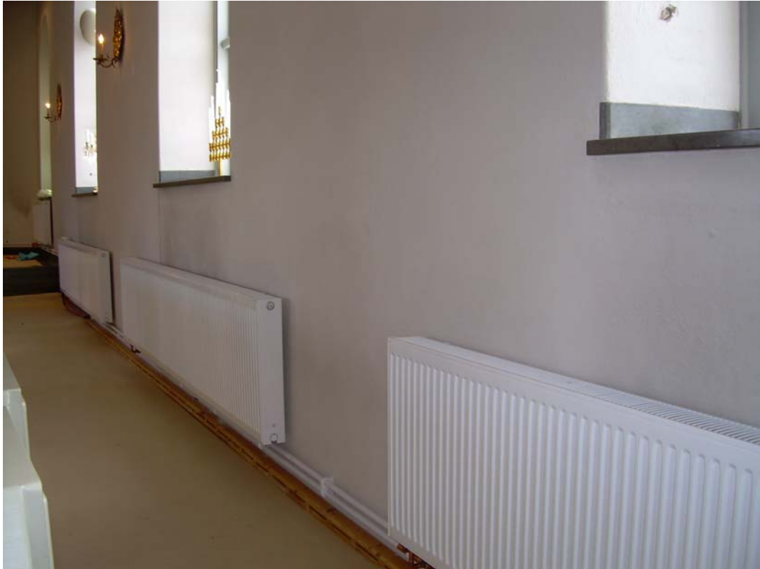
2008-02-28. Nya vattenburna radiatorer vid södra väggen. Radiatorerna är placerade så nära golvsockeln som det är möjligt .