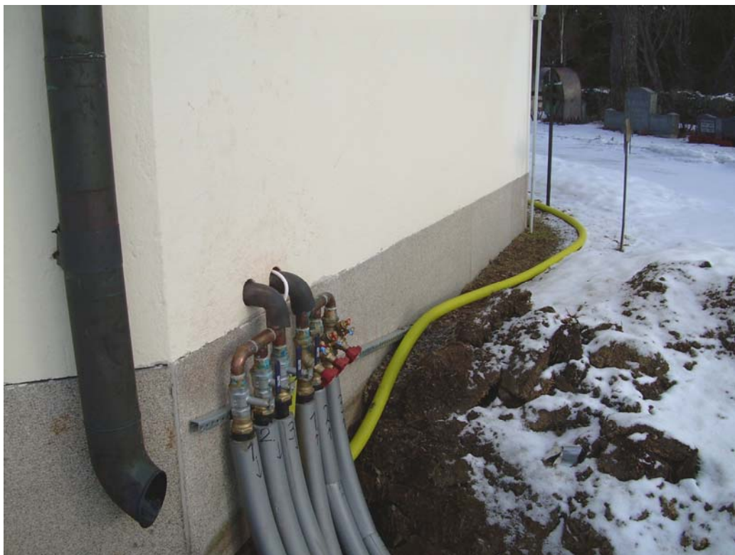
2008-02-28. Anslutning till bergvärmens och rördragning i sydost.

I förrådet bakom koret har värmepumpen installerats. Från pumpen i förrådet går nya vattenburna ledningar av koppar till kyrkans nya radiatorer. Ledningarna från värmepumpen i förrådet drogs genom korväggen till koret, där nya vattenburna radiatorer har installerats.