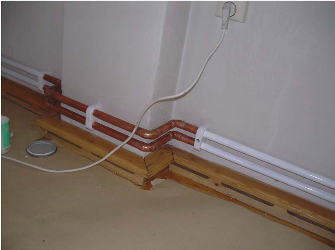
2008-02-28. Rödrugning förbi pilaster.