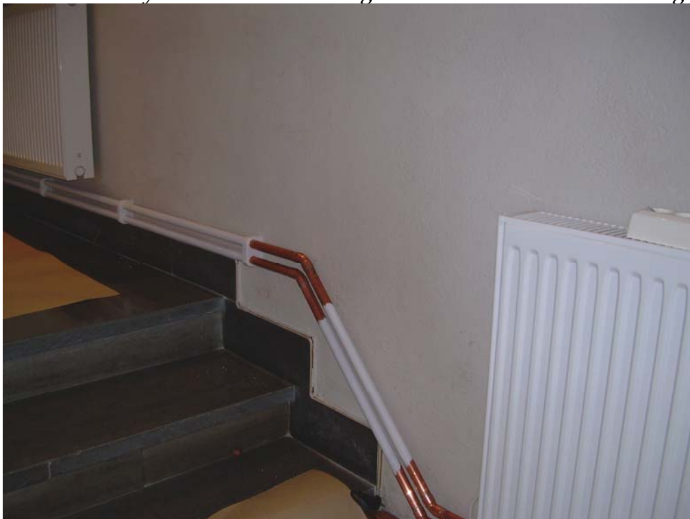
2008-02-28. Rörledning och nya radiatorer utmed södra väggen vid koret.